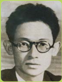
▲ 이효석 (1907~1942)

한국 현대문학의 대가 가산 이효석 선생을 배출한 봉평 효석문화마을은 「메밀꽃 필 무렵」의 실제 무대이기도 하다. 해마다 9월이면 하얀 소금을 뿌린 듯 흐드러지게 핀 메밀꽃이 보기만 해도 숨이 차오를 듯 문학적 정감에 젖게 한다.